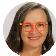
Mme Le Vagueresse Animatrice Pastorale